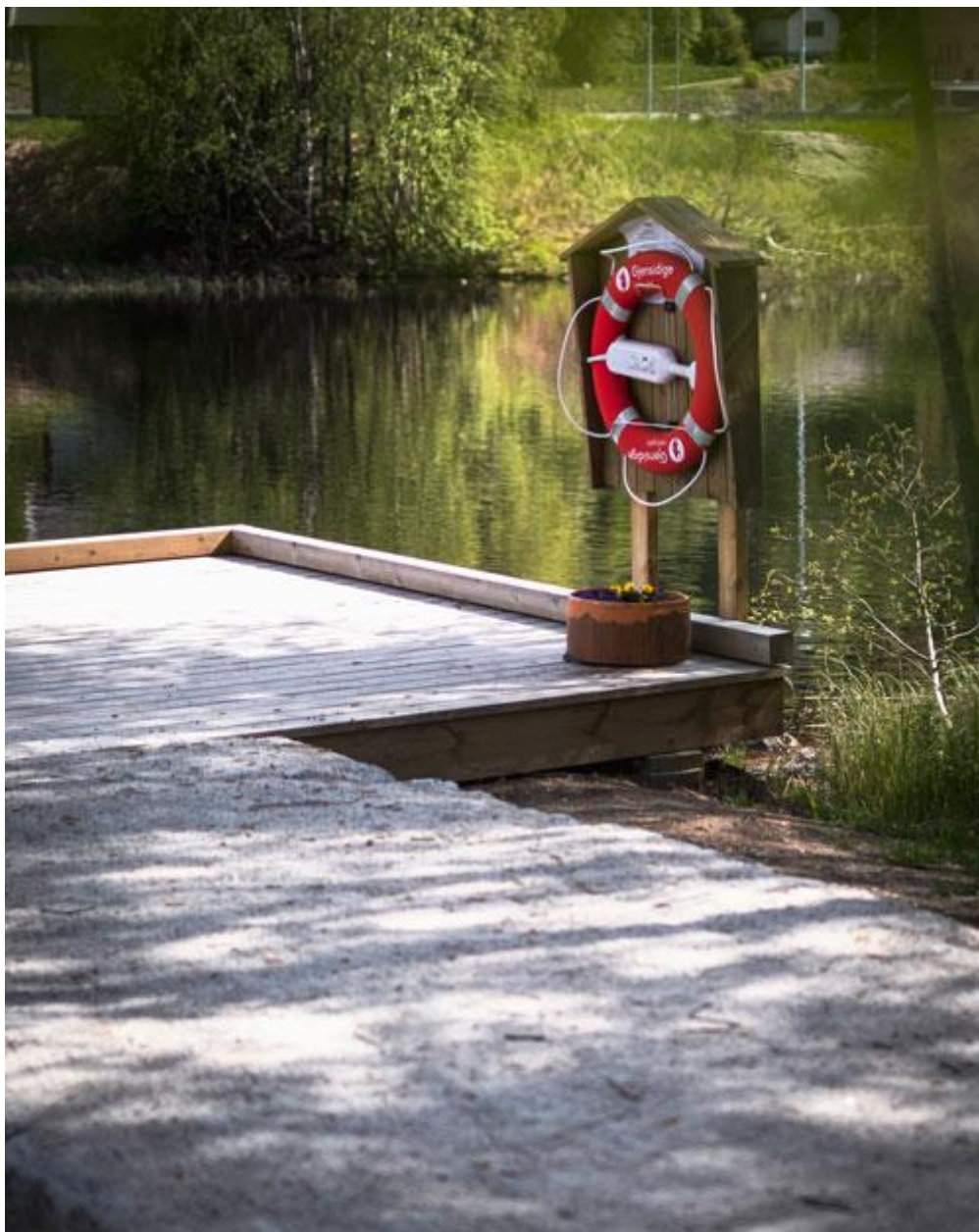
Hallingdal Gjensidig Brannkasse